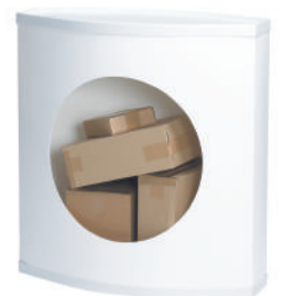
L'ouverture en option d'un côté à des fins de stockage.