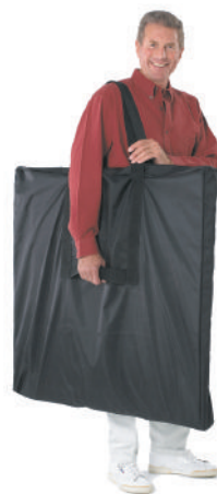
Sac de transport

Les plateaux, socles et corps des SOLUS et STANDALONE PROMOTOR sont disponible en blanc ou noir, une option plateaux ou socles imitation bois est également possible.