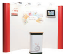
ExpoFix prestige avec écran et valise comptoir