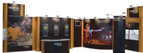
Configuration élaborée intégrant tours, vitrines, comptoir et bandeaux suspendus.