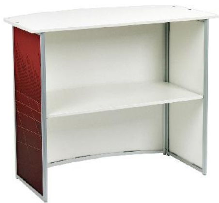
Counter Frame standard