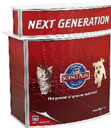
Counter Frame Bar