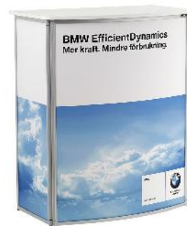
Counter Frame Démo